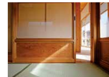
アク抜きした味のある木彫りの建具