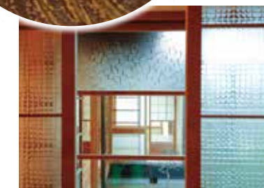
リメイクしたレトロなガラス戸